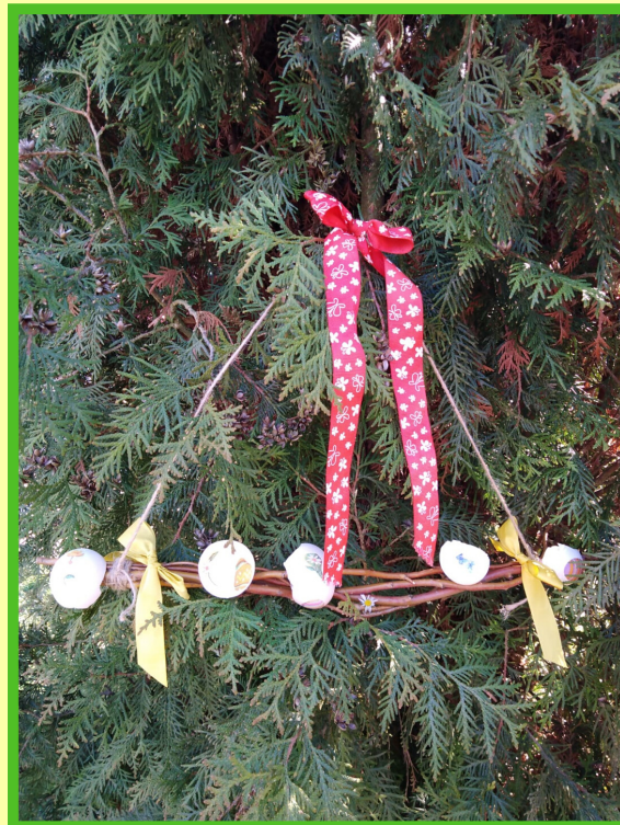
Zacházejte s nimi opatrně, aby se nepoškodily skořápky.