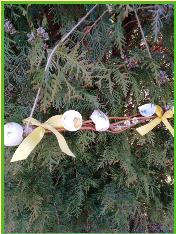
Zde je více ozdobených větvíček.